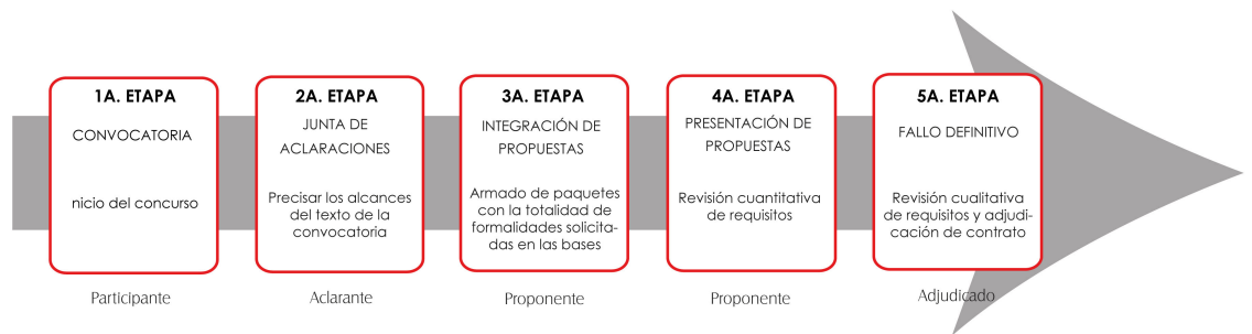
Ilustración 1: Etapas de los procesos concursales.